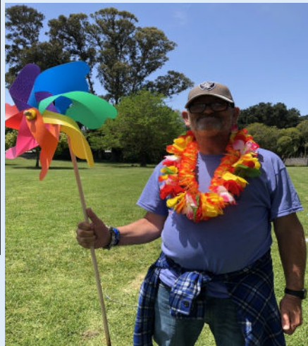
Disfrutando la vida juntos!